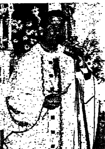
الحضور في القداس

المطران הראعي: تقف على صخرة متينة وسنواجه العاصفة مهما كانت جارفة